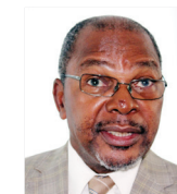
TEODATO HUNGUANA Antigo Ministro da Justiça

16:30 - 18:00 “JUSTIÇA, REFORMAS E DESENVOLVIMENTO ECONÓMICO”