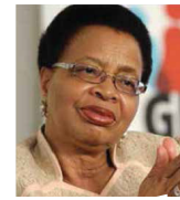
GRAÇA MACHEL Presidente da Fundação para o Desenvolvimento da Comunidade

10:30 - 12:00 “O CONHECIMENTO COMO ACELERADOR DA IGUALDADE DE GÉNERO”