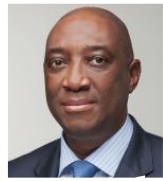
OLDEMIRO BALÓI Ministro dos Negócios Estrangeiros e Cooperação de Moçambique