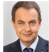
JOSÉ LUIS ZAPATERO Antigo Primeiro-Ministro de Espanha

9:45 - 11:15 “A INCLUSÃO SOCIAL COMO ALAVANCA PARA O DESENVOLVIMENTO SUSTENTÁVEL”