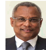
JOSÉ MARIA NEVES Antigo Primeiro-Ministro de Cabo Verde

10:30 - 12:00 “AS INSTITUIÇÕES COMO PILAR DE DESENVOLVIMENTO”