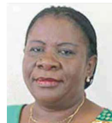
LUÍSA DIOGO Antiga Primeira-Ministra de Moçambique