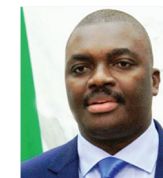
EDSON MACUÁCUA Deputado da Assembleia da República