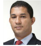
CELSE CORREIA Ministro da Terra, Ambiente e Desenvolvimento Rural de Moçambique