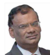
RAMA SITHANEN Antigo Ministro das Finanças e Vice-Primeiro-Ministro das Maurícias