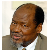
JOAQUIM CHISSANO Antigo Presidente da República de Moçambique