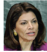
LAURA CHINCHILLA Antiga Presidente da República da Costa Rica

8:30 - 10:00 “ECONOMIA DO AMBIENTE E DESENVOLVIMENTO SUSTENTÁVEL”