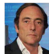
PAULO PORTAS Antigo Ministro de Portugal

16:30 - 18:00 “REFORMAS ECONÓMICAS COMO INDUTOR DE CRESCIMENTO”